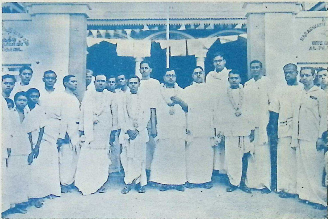
புதுவயல் ஸ்ரீ சரஸ்வதி சங்கத்தில் உருவப்படங்கள் திறப்பு விழா 11—9—1939.