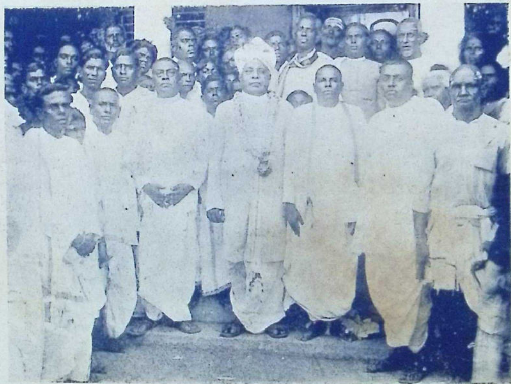
புதுவயல் ஸ்ரீ சரஸ்வதி வித்தியாசாஸிரின் புதிய கட்டிடத் திறப்புவிழா. 24—4—1939.