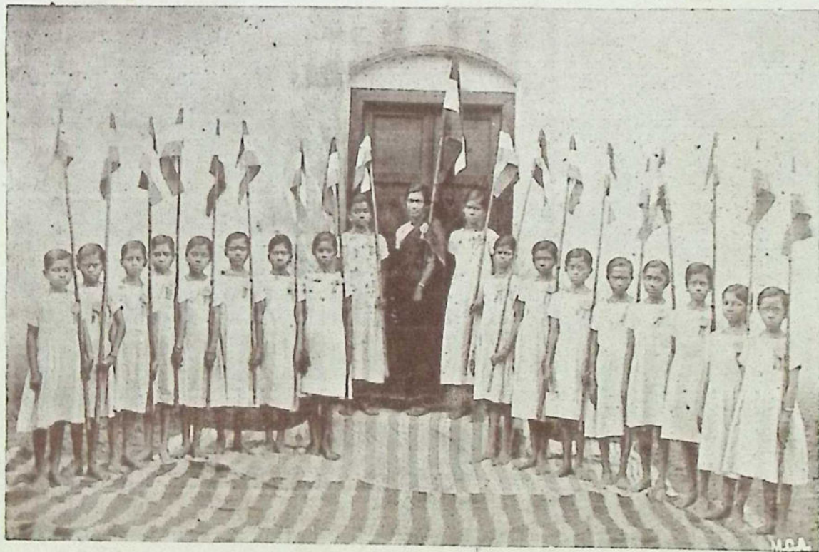
காரைக்குடியில் ஈடைபெற்ற 37-வது தமிழ் மாகாண அரசியல் மகாநாட்டிற்குச் சென்று தோண்டாற்றிய புதுவயல் பூச்சரஸ்வதி வித்தியாசாலை பெண் தோண்டர்கள்.